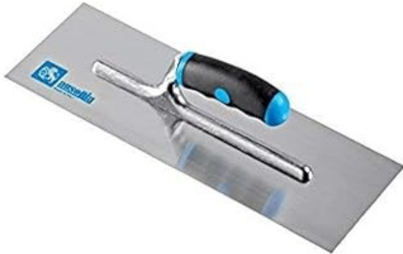
LLANA PARA ESTUCO.....