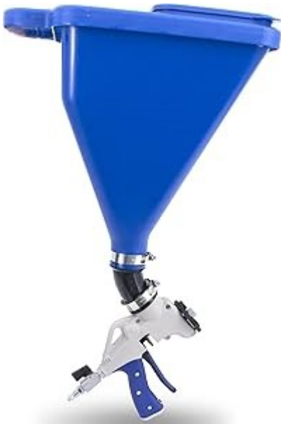
PISTOLA DE EMBUDO.....