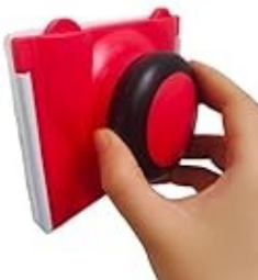
HERRAMIENTA PARA BORDES..